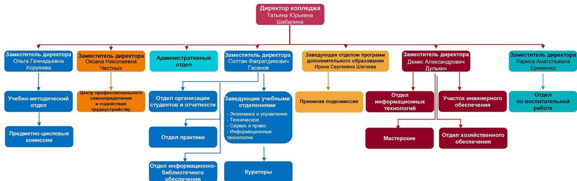
Рисунок 1 – Организационная структура КМПО РАНХиГС