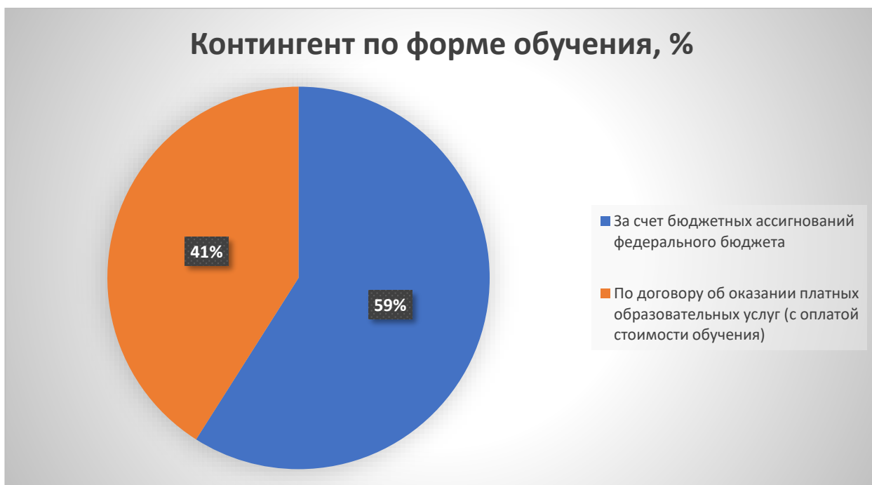
Рисунок 2 – Контингент по форме обучения

В Колледже осуществляется обучение за счет бюджетных ассигнований федерального бюджета и по договору об оказании платных образовательных услуг (с оплатой стоимости обучения) (рисунок 2).